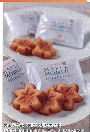
カエデの花言葉は「大切な思い出」。大切な時間を共有したい人へ。8個入り1,296円

モミジをかたどった、おみやげに人気の銘菓。袋を開けると広がる甘い香りはサトウカエデの樹液から作られたメープルシュガーがたっぷり生地と練り込まれているから。外はサクッと中はしっとりとした食感。メープルのふんわりした甘さとアーモンドの香ばしさが美味しい。2014年から「モンドセレクション」10年連続金賞受賞。