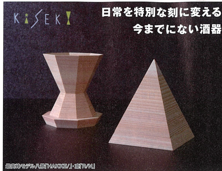
最高峰モデル八角「HAKKEI」・壺「R/N」