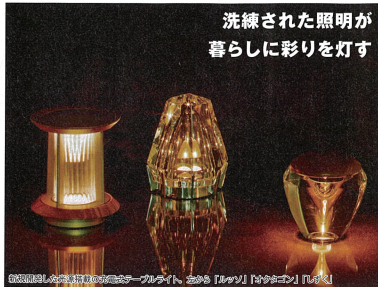
新規開発した光源搭載の充電式テーブルライト。左から「ルッソ」「オクタゴン」「レバク」