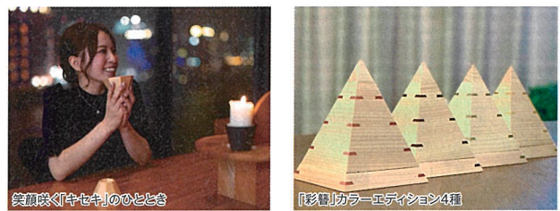
笑顔咲く「キセキ」のひととき

「おもてなしセレクション2024」で最高金賞を受賞した、形が変化する独創的な酒器。一見するとピラミッド型の四角錐(八角錐)だが、ひっくり返す事で形が変化するという驚きからその感動が始まる。芳醇な檜の香りで五感を刺激し、飲み口を極限まで薄く仕上げることで、口当たりをまるやかに仕上げた、日本の技術が光る逸品。