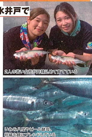
2人の若い女性が丹精込めて育てている

井戸掘りを専門とする同社が山陰ジオパークの地下海水井戸で育てたサバを販売する。クリアな地下海水で育つことにより寄生虫などのリスクが低減されるため生で食べられる。地中熱や太陽光などの自然エネルギーを活用し、CO2削減や脱炭素化など環境に配慮した飼育環境を整備している。これからの新しい漁業スタイルに注目だ!