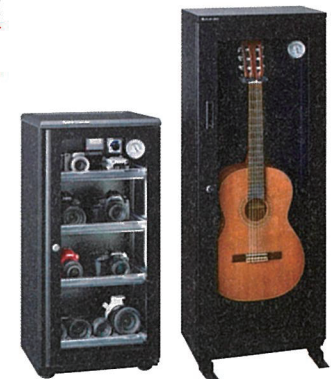
左: ED-120CATP3(B) 右: フラットドライ(恒湿保管庫)50%一定保持

除湿機能と光触媒効果により庫内を低湿度でクリーンな状態に保ち、カメラやレンズ、貴金属、トレカなど様々なものを湿害から守ってくれる。心臓部である電子ドライユニットは日本国内の自社工場で作成し、高い品質・信頼性・豊富な製品バリエーションが魅力。同社は2024年で創業50年を迎え、防湿庫のバイオニアとして50年の実績を誇る。