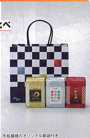
市松模様のオリジナル紙袋付き

「おもてなしセレクション2024」にて、最高金賞を受賞した逸品。ふわりとした食感、豊かな甘み、変わらない粘りの「金色の風」。食感は軽やかで、透明感のある白さとバランスのとれた食味の「銀河のしずく」。粘りと甘みのバランスがとれた「金札米江刺産ひとめぼれ」。各450g(約3合)と食べ比べにもちょうど良いため、ギフトとしておすすめしたい。